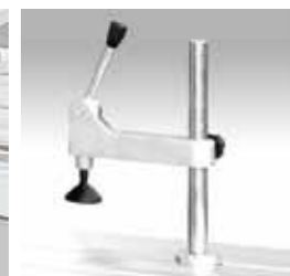
STANDARD Pressalegno Wood presser presseur de bois Holzspanner Prensamadera Прижим