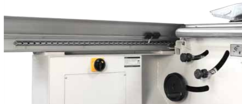
Bloccaggio Carro in tutte le posizioni Blocage du chariot dans toutes les positions Bloqueo carro en todas las posiciones