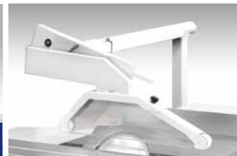
OPTION - STANDARD FOR USA-CANADA Protezione a parallelogramma bocca Ø 80 mm / Parallelogram guard Ø 80 mm / Protecteur lame sur potence Ø 80 mm / Parallelogrammsägeschutz - Absaughaube Ø 80 mm / Protección del disco colgado Ø 80 mm / Параллелограммная защита пилы с аспирационным отверстием 80 мм