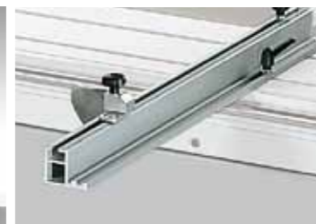
OPTION Squadra in alluminio + 30° - 45° +30°-45° tilting aluminium fence Guide en aluminium + 30° -45° Alu-Gehrungsanschlag +30°-45° Escuadra en aluminio + 30° -45° Алюминиевый упор +30°-45°