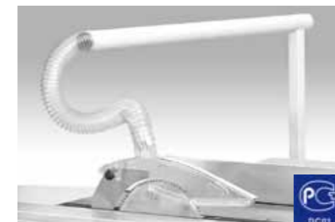
STANDARD BASIC Protezione GOST / GOST safety guard Protecteur GOST GOST Schutzvorrichtung / Protección GOST / Защита пилы по ГОСТ стандартная комплектация.