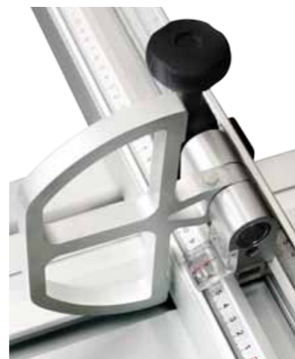
Sliding table locking in all positions Blockierung des Alu-Schlittens in allen Positionen Блокировка каретки во всех положениях